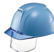
ライトブルー/ブルー B-4/V-5