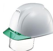
ホワイト/グリーン W-1/V-3