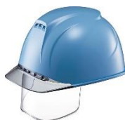
ライトブルー/グレー B-4/V-2